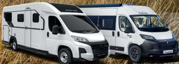
Bürstner Signature 7.1 SFT